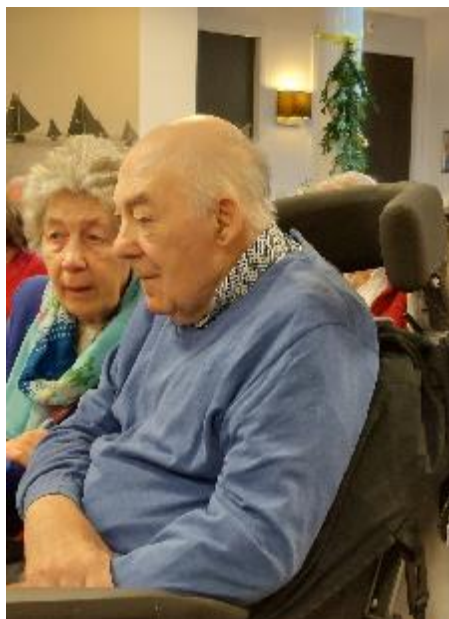
Familie geniet van samenzijn

Er is waar nodig extra contact geweest met families en naasten om te luisteren naar hun verhaal