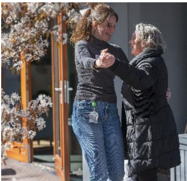
Samen dansen op een eerste lentedag

De Oude Pastorie heeft corona lange tijd buiten de deur weten te houden, maar eind augustus hebben ook wij de impact van corona ervaren in De Oude Pastorie op bewoners en collega's die door dit virus werden getroffen