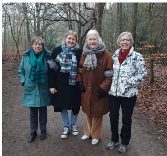
Samen wandelen in de mooie Gooische natuur, met zorg voor elkaar

Gezamenlijke overleggen met alle disciplines hebben beperkt plaatsgevonden (zie het vergaderschema 2021) Inzet DOP Update om medewerkers regelmatig goed te informeren over relevante onderwerpen Medewerkers hanteerden de RIVM richtlijnen zorgvuldig in het dagelijks leven en lieten zich zo nodig preventief testen