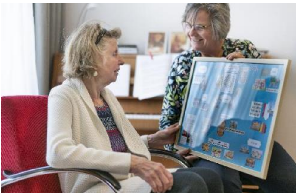
Het levensschilderij als basis voor het persoonlijke leefplezierplan

Werkgroep welzijn opgericht om hier nog meer aandacht aan te geven