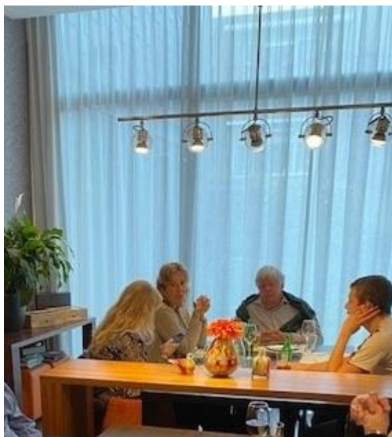
Gezellig samen eten met familie

Het mee-eten van familie en naasten in de serre is halverwege het jaar weer opgestart in aangepaste vorm