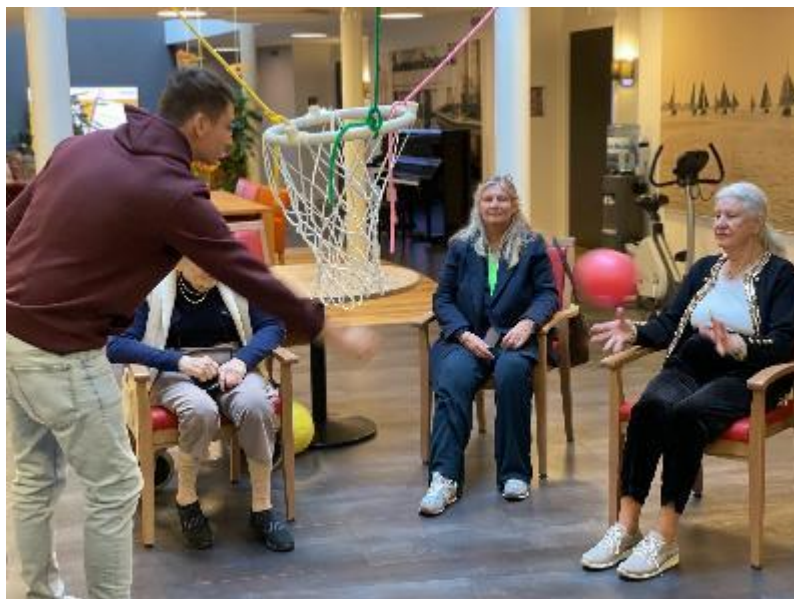
Samen bewegen vanuit de stoel

Er zijn alternatieve activiteiten binnenshuis opgestart