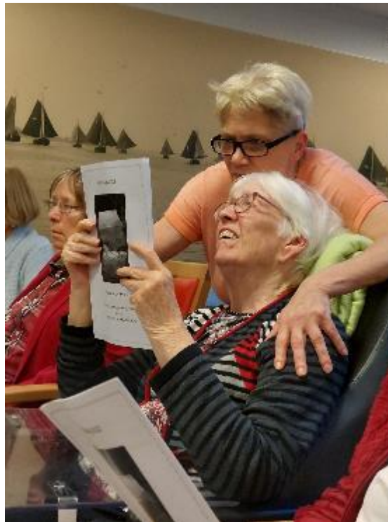
Samen genieten van de muziek en het meezingen

Medewerkers werkten 24 uur per week en/ of zoveel mogelijk minimaal drie dagen per week Er is een vast team met veelal contracten voor onbepaalde tijd Werken met het levensschilderij en leefplezierplan zorgt voor een grotere vertrouwensband